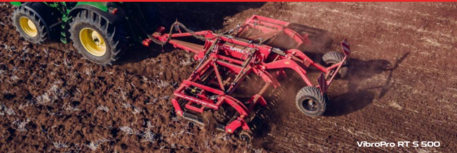
VibroPro RT S 500