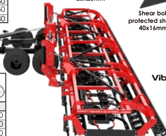
VibroPro XL S 1000